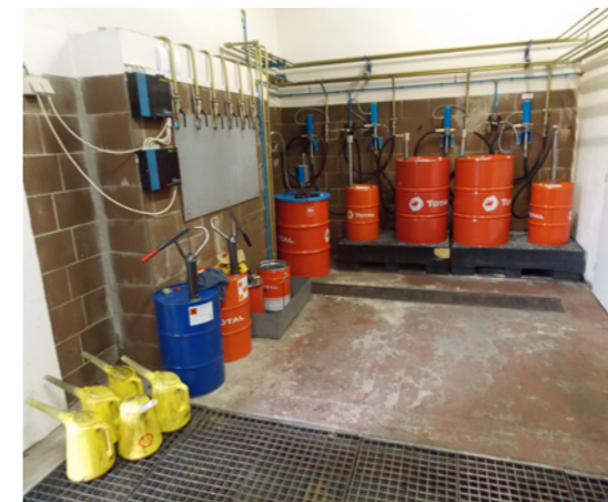
Počátky servisu jsou spojeny s oleji ve dvousetlitrových sudech, prostor je však připraven na větší olejové tanky