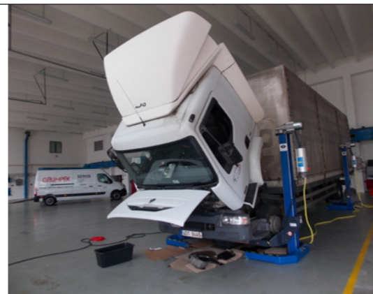
Pojízdné sloupové zvedáky na těžká nákladní vozidla pocházejí od firmy Maha Consulting