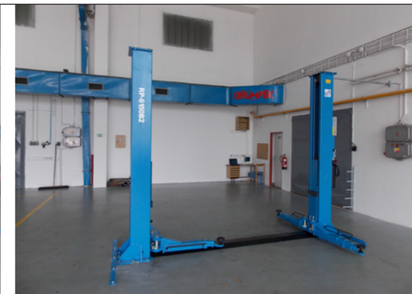
Pro automobily do hmotnosti pěti tun slouží pevně zabudovaný zvedák