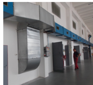
Servis splňuje veškeré podmínky pro vzduchotechniku