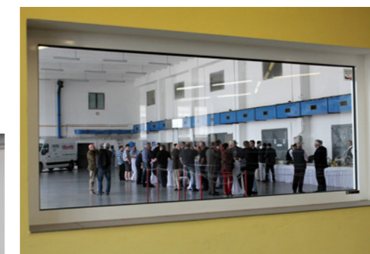
Slavnostní otevření proběhlo přímo v hale, do které mají řidiči opravovaných automobilů otevřený výhled

Galimpex nabízí i výjezdní služby, vozidlo také může posloužit k akutnímu dovezení specializovaného náhradního dílu