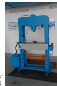
Mechanickým opravám je k dispozici výkonný lis (70 tun)