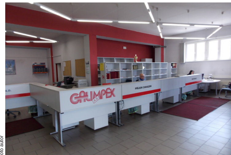
Vstupní prostory servisu jsou reprezentativní

Majitel servisu Miroslav Galovič pečuje o servis i dobré pracovní vztahy zaměstnanců