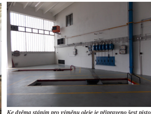
Ke dvěma stáním pro výměnu oleje je připraveno šest pistolí